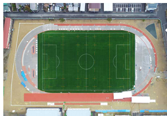
12月22日 トラック部分の全天候舗装工事が進んで います。来年2月まで行います