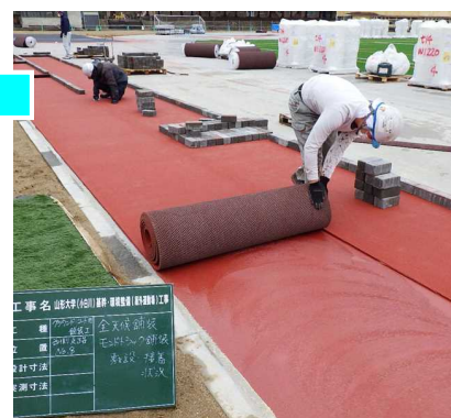
シート状の舗装材を、接着剤 を塗ったところに敷いていき ます