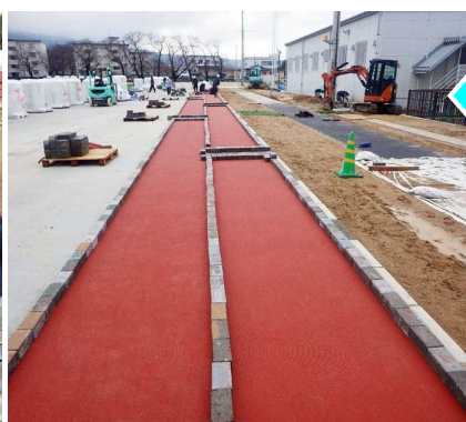
舗装材がきちんと接着するよう に、重石(おもし)を置いて養生 しています