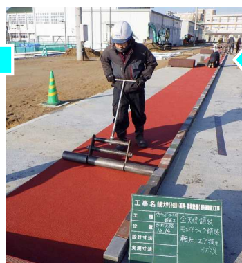
空気を抜き、接着力を高 めるため、ローラーで押し ます