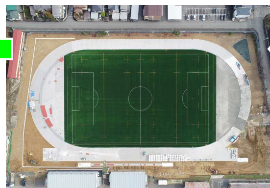
11月29日 フィールド部分の工事完了。トラック部 分のオレンジ色の全天候舗装工事が始ま りました