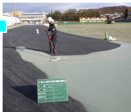
下地舗装の隙間をなくすため、 目止め材を塗っています