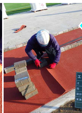
シートの貼り合わせ部分を調整しています