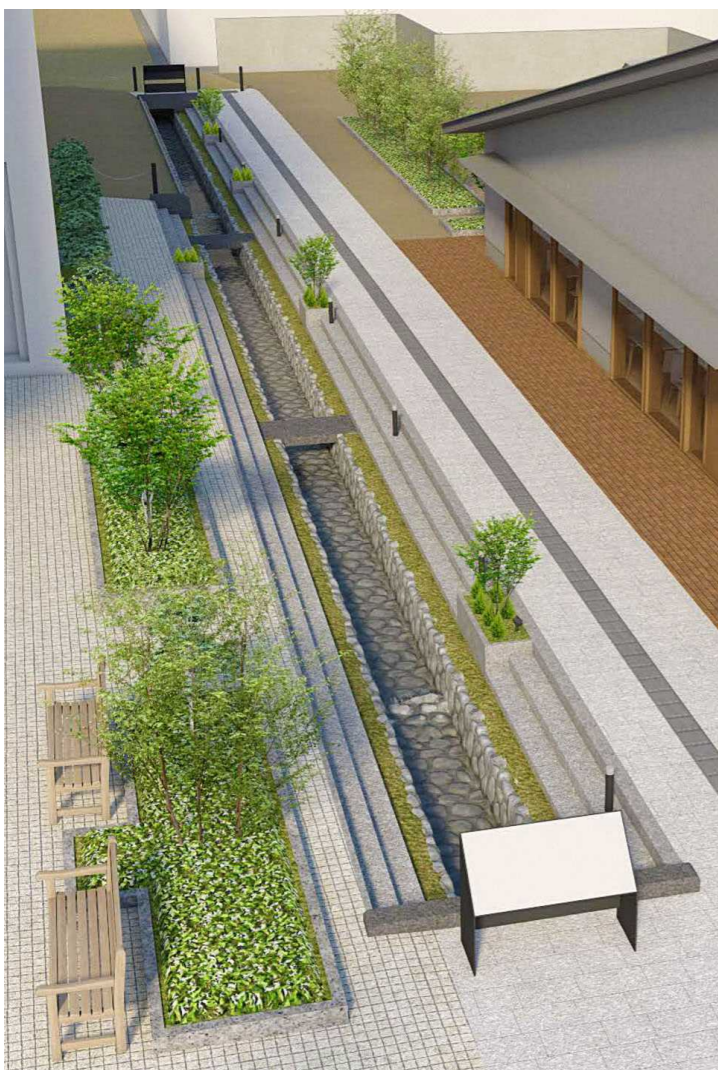
手前が国道112号線側(東側)です