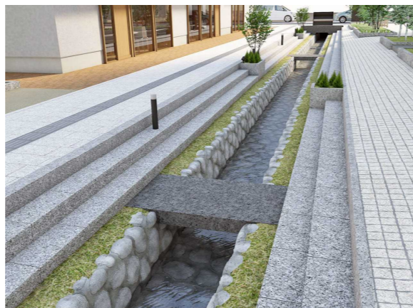
石積みの堰 (水路) に生まれかわります