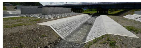
右岸側（北側）の用水路も完成 (P2橋脚とA2橋台の間)