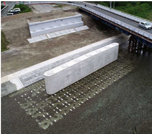
P1橋脚の周りに護床ブロックを設置