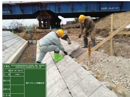
A2橋台（右岸側（北側））下に、護岸ブロックを設置しました