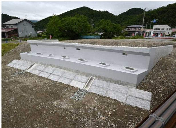
完成した左岸側（南側）のA1橋台