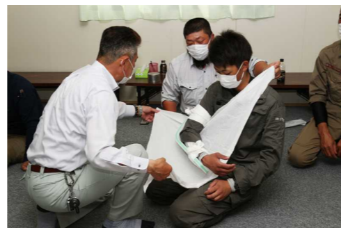
傷病者役（右）の右腕骨折の想定で、講師（左）が骨折部の固定方法と腕の吊り方を指導しています