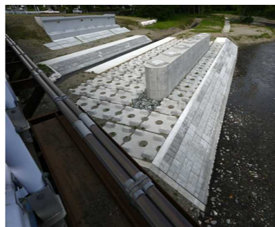
P2橋脚の周りに護床ブロックを設置