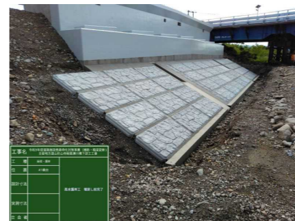
A1橋台（左岸側（南側））下に、護岸ブロックを設置しました