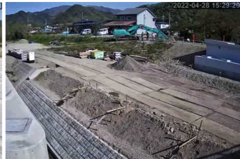
P1橋脚の周りに護床ブロックを設置しています。左岸（南側）には、護岸ブロックを設置しました