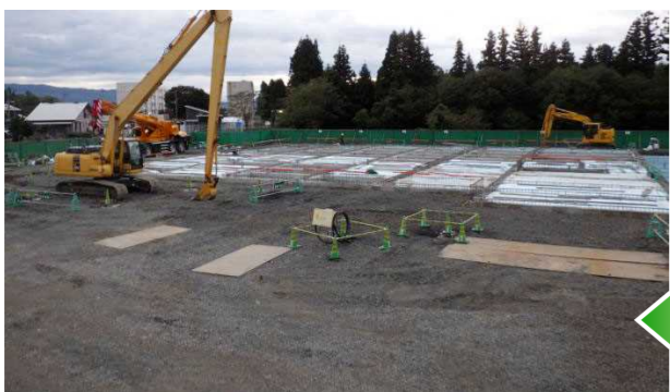
11月上旬 基礎の工事が完了し、埋め戻し作業を行っています。写真は、土間(1Fの床)の工事などを行っているところです