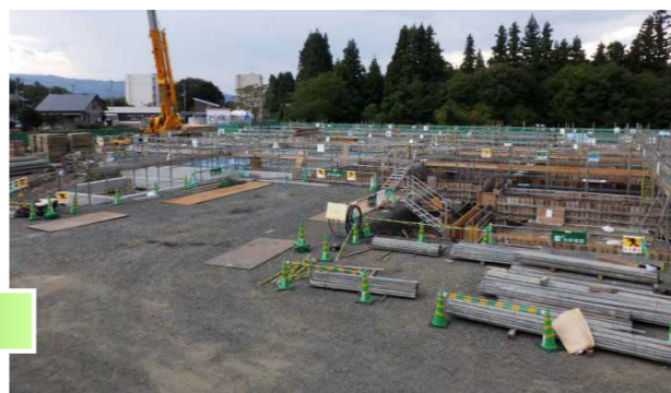
10月上旬 引き続き、基礎工事を行っています