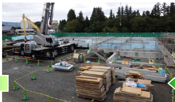
10月中旬 基礎工事を行っています。基礎ができあがってきました。一部、埋め戻しを行っています