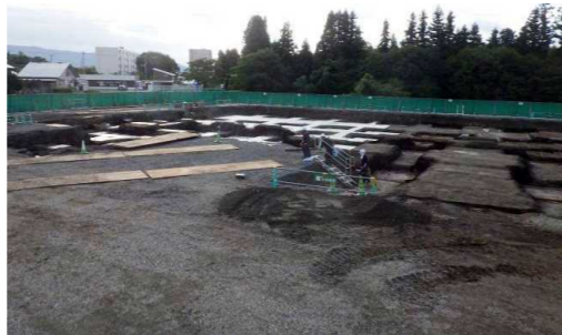
9月上旬 基礎工事のための、掘削工事を行っています