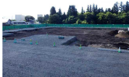
8月下旬 地盤改良工事を行っています。地盤改良とは、基礎工事の前に、地盤を安定させるための工事です