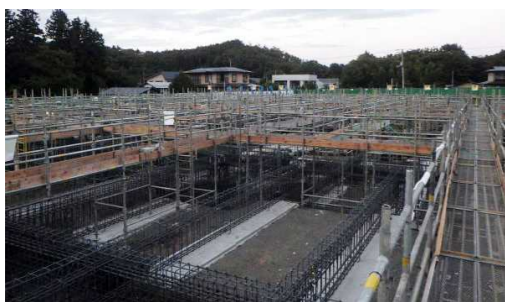
9月中旬。基礎工事が始まりました。鉄筋や型枠(コンクリートを流し込むための木枠)を組み立てるための足場を組み立てています。